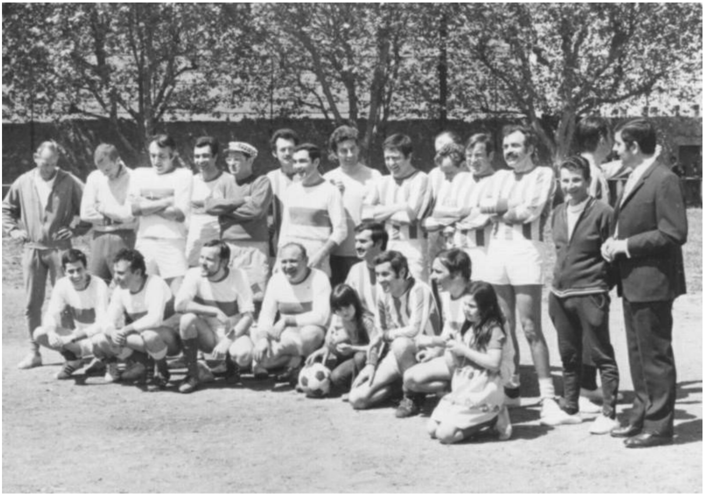
1972 à KIN Match des 15 ANS DE SORTIE