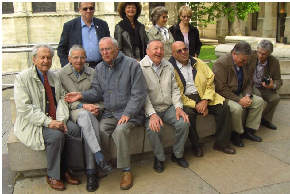
2008 en attente de visite au Conservatoire des Arts et Métiers