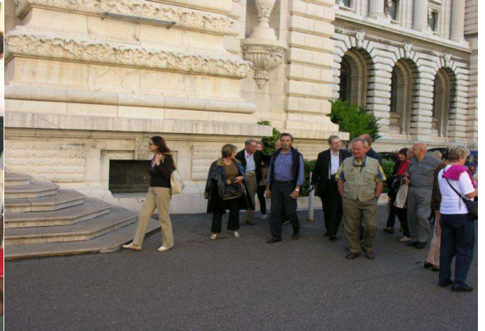
2005 CANNES - MONACO