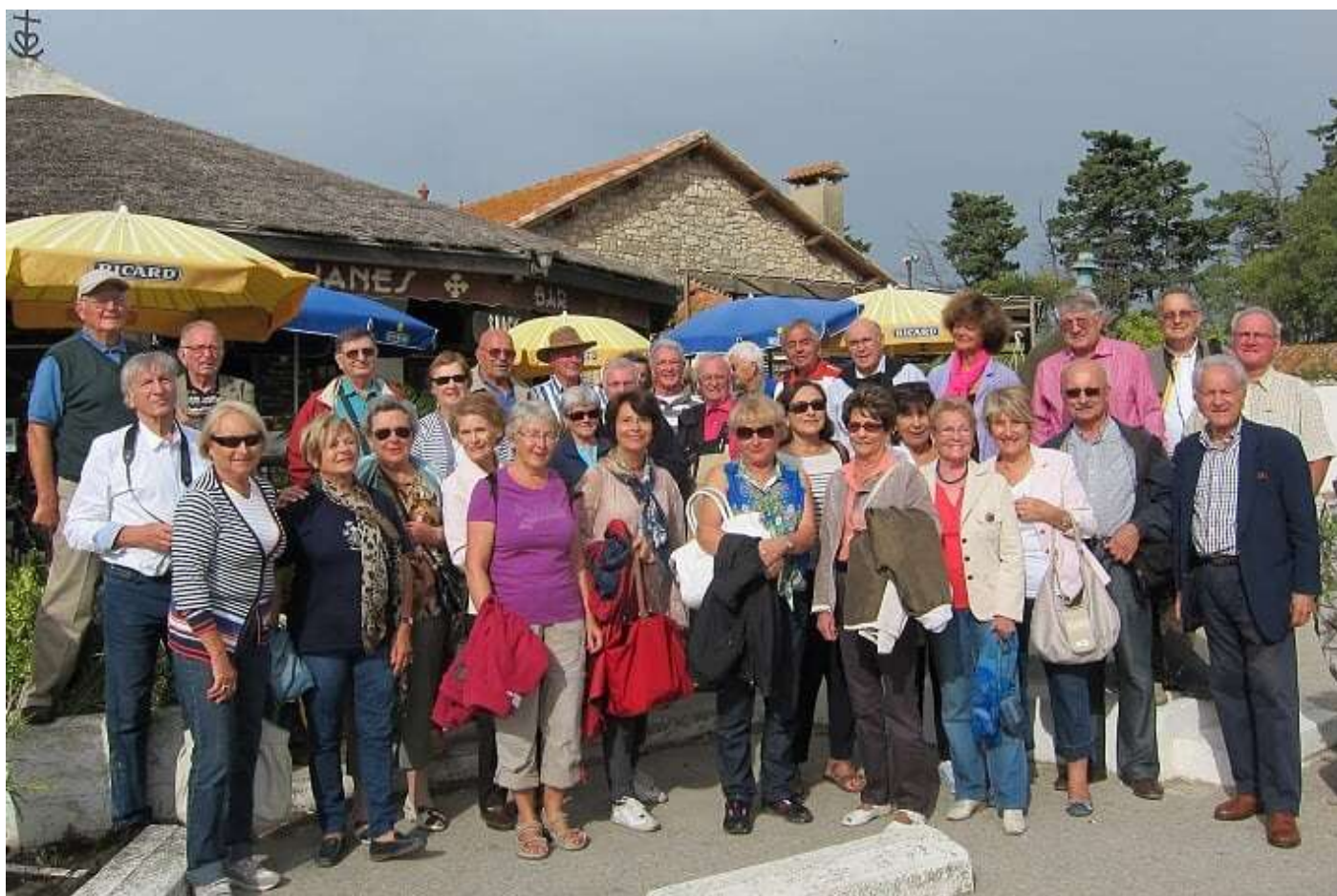
2013 ARLES – BAUX de PROVENCE