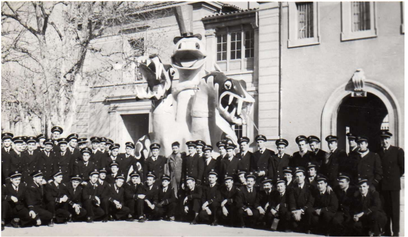
1956 avec TRIVIATHAN