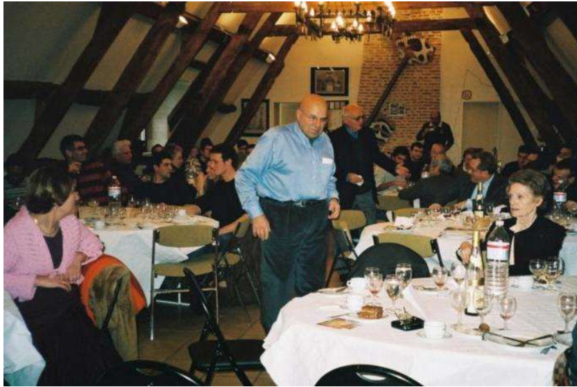
2007 LIANCOURT parrainage de la 204 prête à l'exance et Baguidouze (Méric)