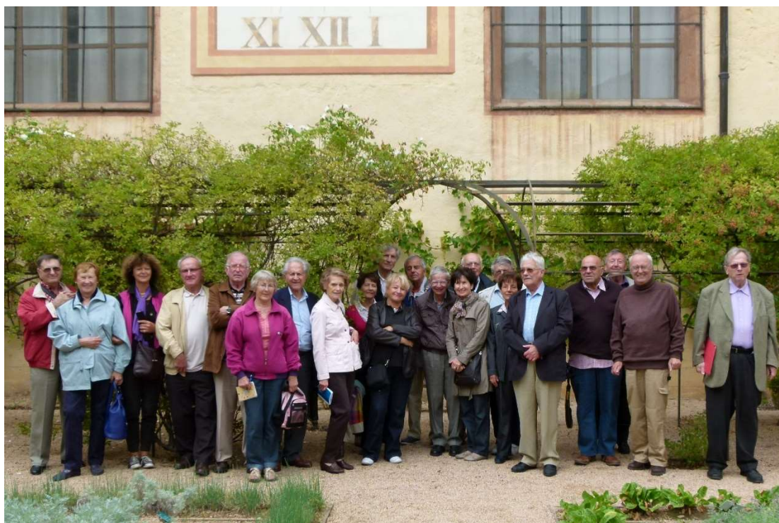
2011 CHALONS sur SAONE