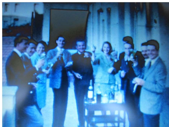
1960-61 ALGER-HUSSEIN DEY