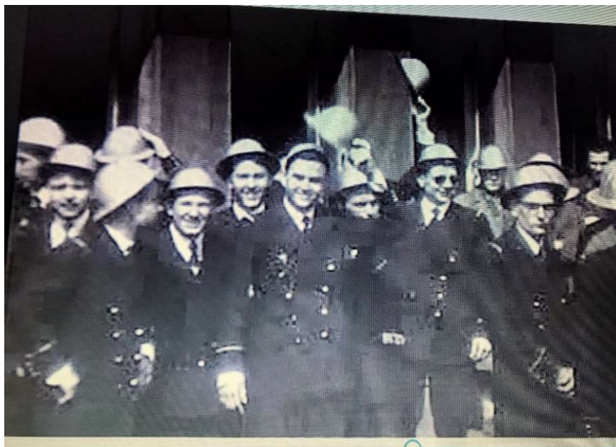
VOYAGE en ALLEMAGNE avril 1957