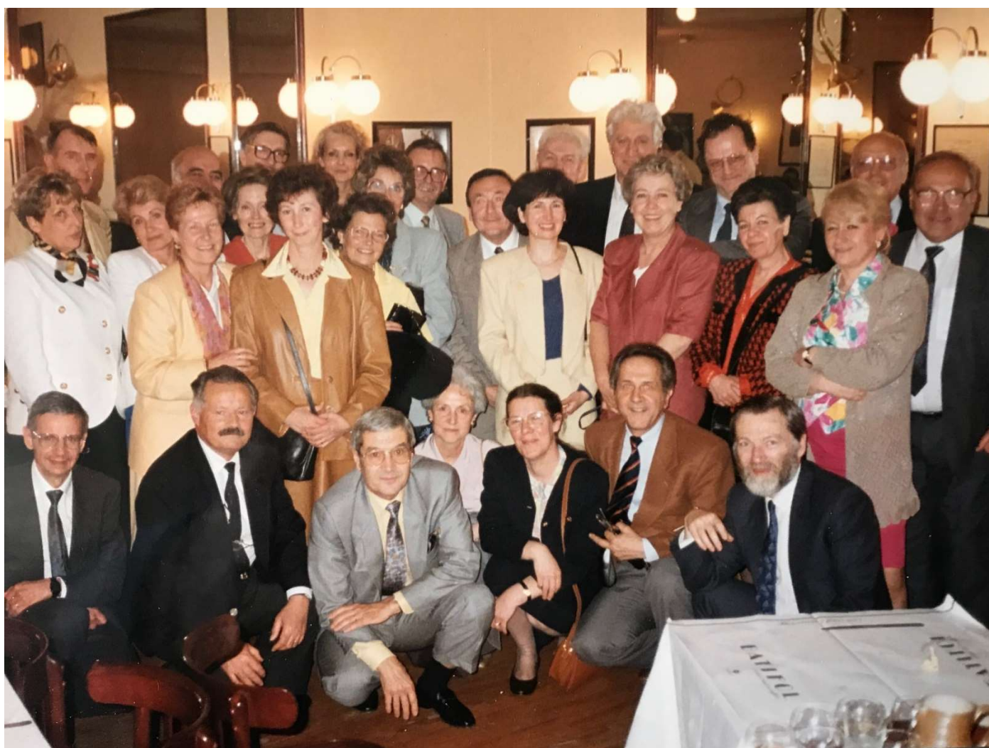
1993 NEUILLY au Batifol