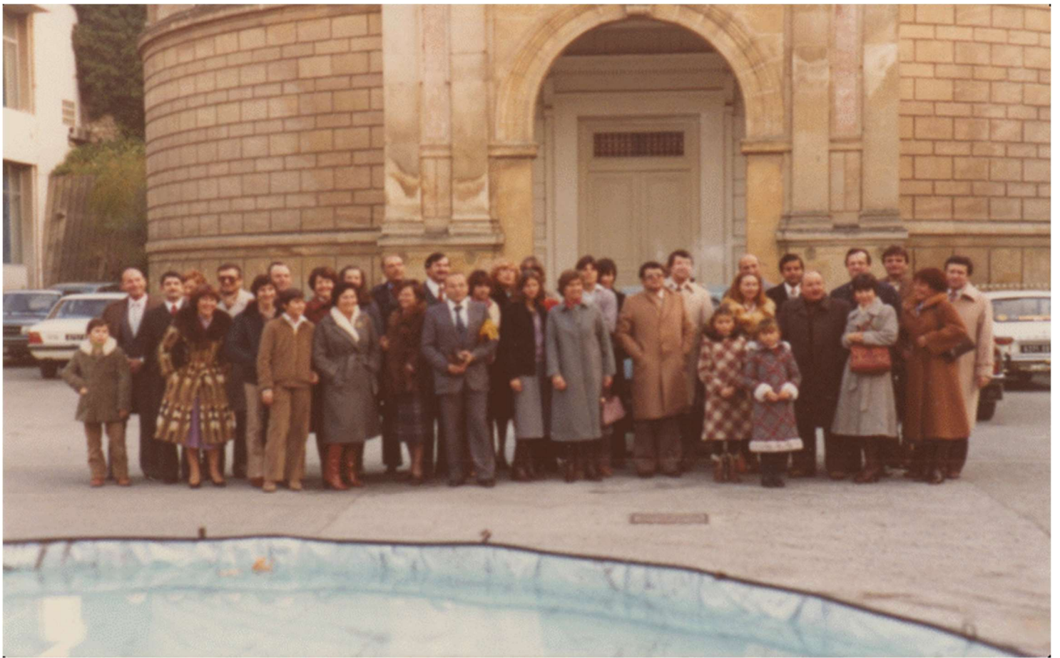
1979 25 ANS D'ENTREE A KIN Au Grand Amphi