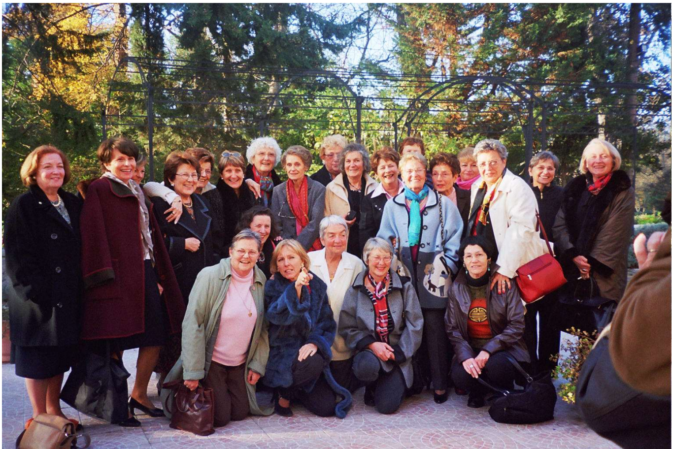
2004 AIX la promo le lendemain après le baptême de la Ai204