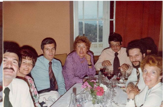
1977 20 ANS DE SORTIE DE KIN à Meyrargues