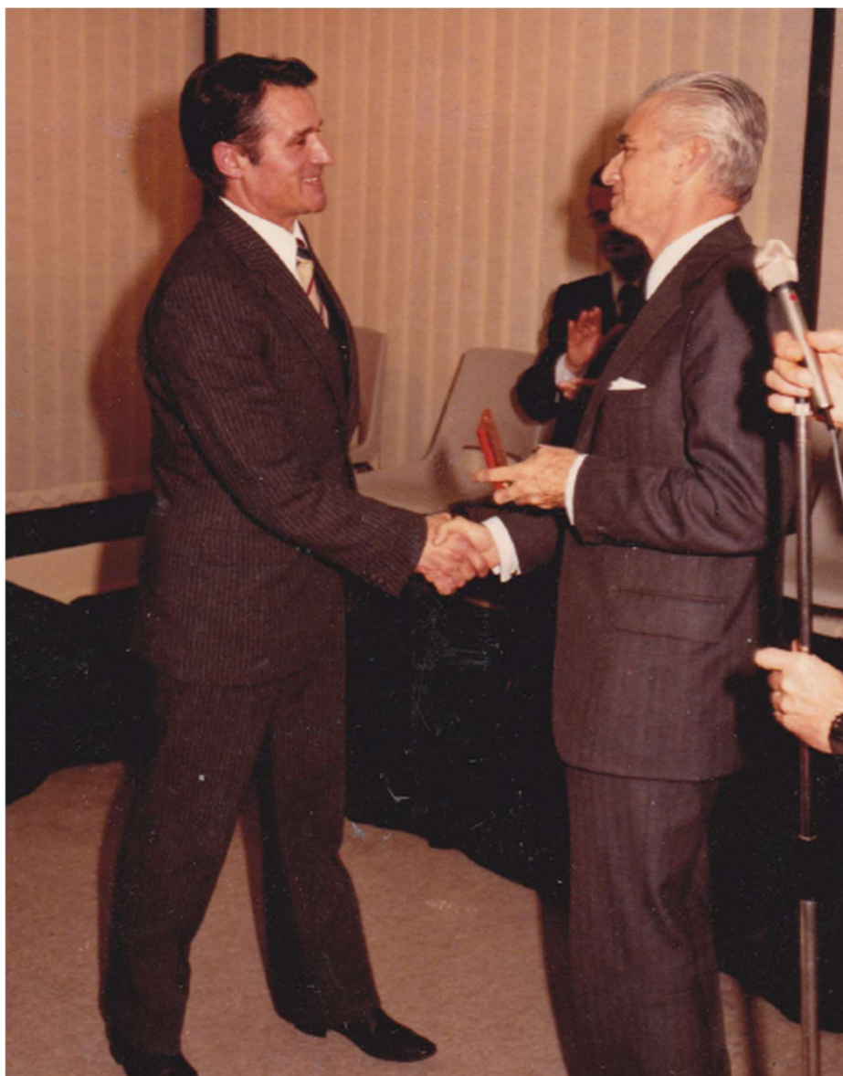
Rencontre avec un Gadzarts d'Honneur