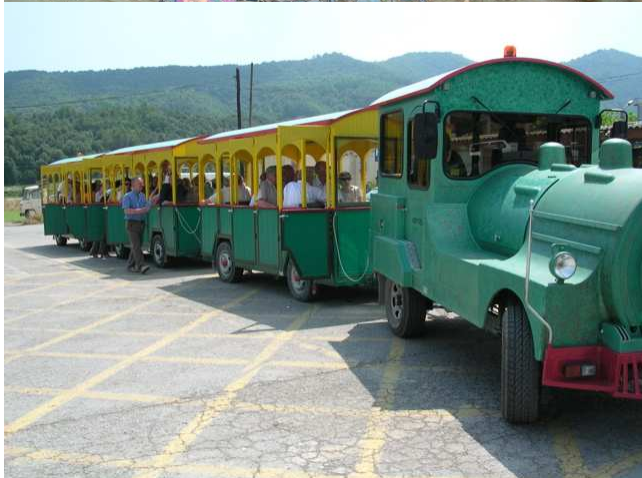
A cet instant, nous avons dépassé les 5% de pertes admissibles ; mais les Charlade et Denis, Dieu merci, nous ont ensuite retrouvés.