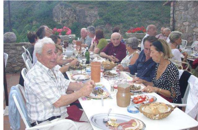
Ils ont traversé les Pyrénées d'Ouest en Est pour nous rejoindre