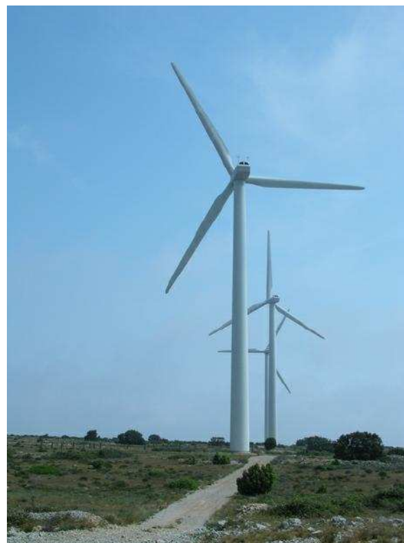
Epilogue à Fitou : A vous couper le souffle, mais il y a aussi à Fitou des vins excellents et un bon restaurant pour atténuer la tristesse des séparations.