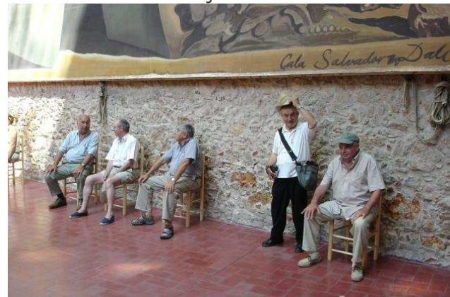
Des feinteurs Dali-fuges repérés ...