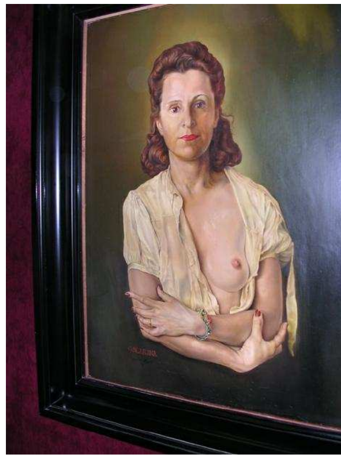
une tenue de Gala ...