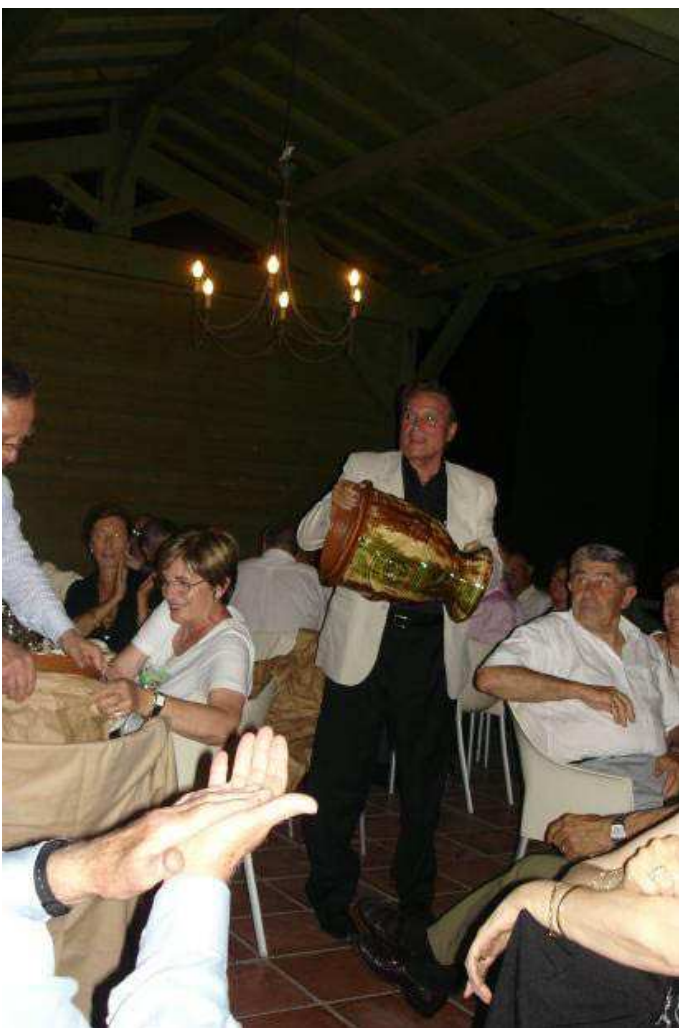
Le Chef de Projet à la conclusion de la réun's