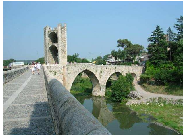
Besalou : il suffit de passer le pont