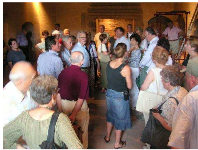
Salses et son guide Commedia dell arte